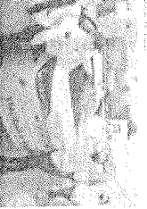
Una mujer en un momento de la atención en el Centro de Atención a la Violencia de Género de la Policía Nacional.

El objetivo principal de estos centros es proporcionar a las mujeres un apoyo integral que les permita superar la situación de violencia que están viviendo y recuperar su autonomía personal.