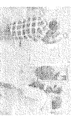
Una mujer en un momento de la atención en el Centro de Atención a la Violencia de Género de la Policía Nacional.

El Sistema de Alerta de Violencia de Género de la Policía Nacional continúa manteniendo su atención a las mujeres víctimas de violencia de género, a través de los Centros de Atención a la Violencia de Género (CAVG) que se encuentran en todas las provincias y ciudades autónomas.